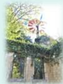
旧フランス領事官邸