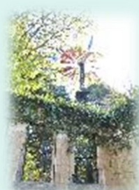
旧フランス領事官邸