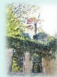
旧フランス領事官邸