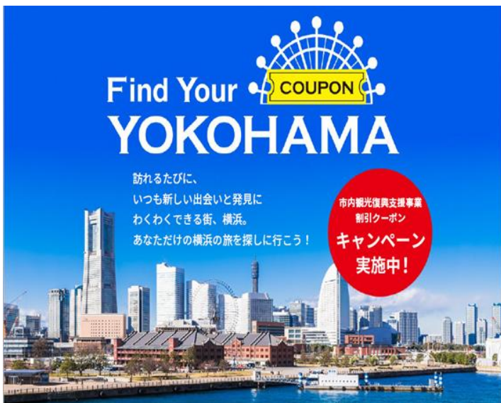
（キャンペーン特設ページイメージ）