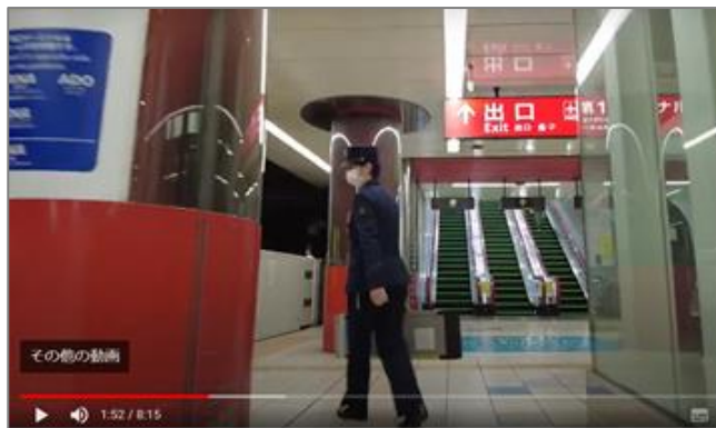
横浜へのアクセス動画（キャプチャ）