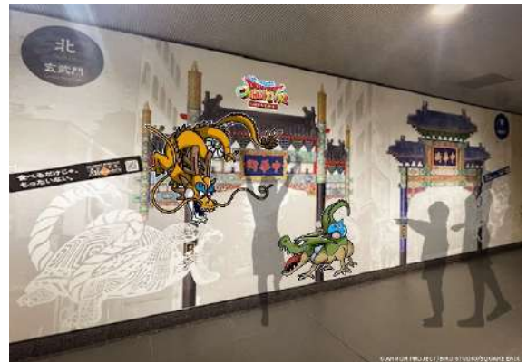
<「スカイドラゴン」と「ドラゴン」のフォトスポットイメージ>