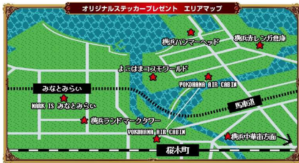
<イベント限定ステッカー配布エリアマップ>

対象店舗で指定メニューの注文やサービスをご利用いただいた方に、 モンスターが描かれたイベントオリジナルの限定ステッカーをプレゼント します。実施場所ごとに異なるイラストのステッカーをお渡しします。各エリアを回り、すべてのモンスターを集めてコンプリートを目指そう！