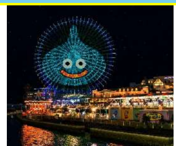
<大観覧車「コスモクロック21」演出イメージ>