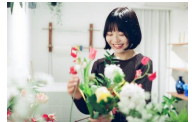
Letter Bouquet監修： フローリスト caco

YCVBでは、2024年9月より「アニバーサリー」×「花」をテーマにした観光誘客のためのブランディング企画『YOKOHAMA PRECIOUS FLOWERS(ヨコハマ プレシャス フラワーズ)』を推進しています。花をテーマとした本プランで、横浜エリアを特別な記念日を過ごす街として、イメージの定着と他都市との差別化を狙います。