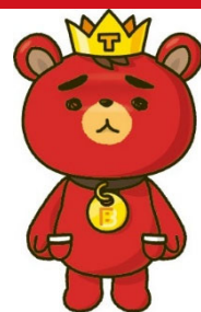
<東方神起ファンクラブ 公式キャラクター「TB」>