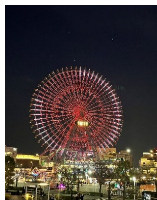
大観覧車「コスモクロック 21」