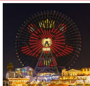
※ 画像はイメージです。

さらに、以下施設で東方神起公式カラーの赤色の特別ライトアップを実施します(再掲)。