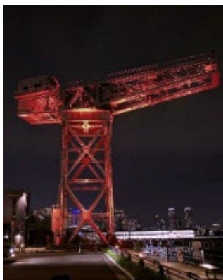
ハンマーヘッドクレーン

※ 今後変更となる可能性があります。最新情報は特設 WEB サイトでご確認ください。