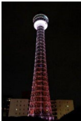
横浜マリンタワー