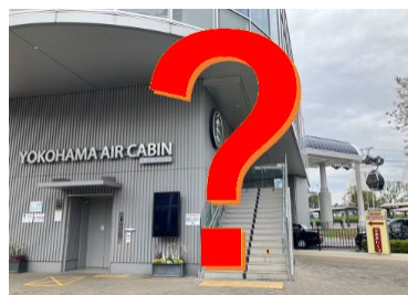
実施場所ごとのデザインは 行ってからのお楽しみ！