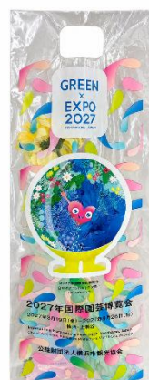
フラワーバッグ(イメージ)

URL: https://www.welcome.city.yokohama.jp/blog/detail.php?blog_id=417