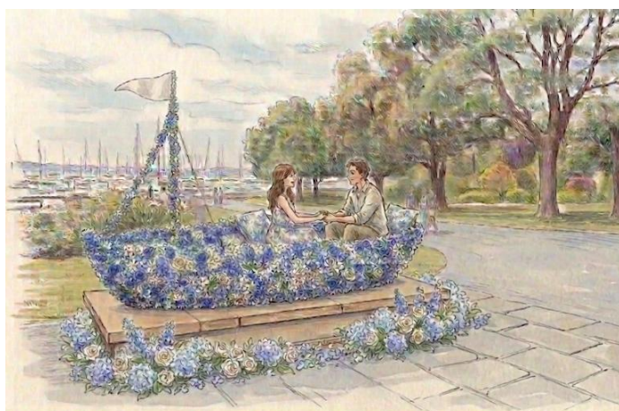
山下公園フラワースポット(イメージ)

今回は「フラワージャックジャーニー第2弾」として、2026年5月30日(土)、31日(日)の2日間、横浜駅西口、象の鼻パーク、山下公園の3箇所に、花の港を体現する「フラワースポット」を設置します。