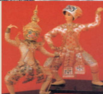
写真はイメージです。実際の展示物とは異なります。

【横浜人形の家】1986年に開館した人形と人形に関する資料を所蔵する博物館。世界各国の人形を集めた「大野コレクション」と日本の人形の「太田コレクション」はいつも変わらない人気を博しています。