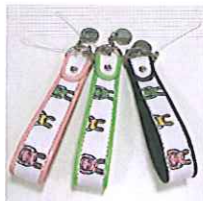
ロディストラップ ¥4,800(税込) 各色25個限定