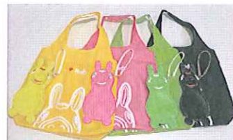
ロディ バッグ イン バッグ ¥12,000 各色25個限定

※取扱店舗 元町本店、ナツキ by キタムラショップ元町店、横浜SOGO店、ランドマーク店、横浜人形の家 特設ショップ