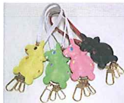
ロディ キーホルダー ¥5,300(税込) 各色25個限定