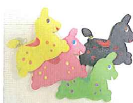
ロディ 小銭入れ ¥5,800(税込) 各色25個限定