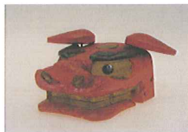
△酒田の獅子頭(山形県)