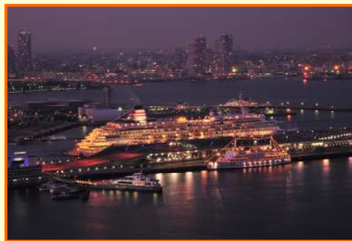
写真家 森日出夫賞 「きらめく大棧橋」 八木沢 通夫さん