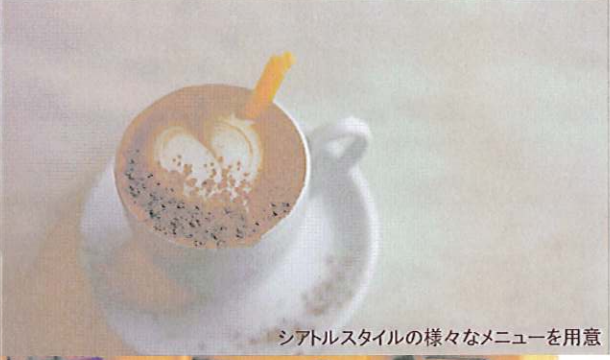
シアトルスタイルの様々なメニューを用意