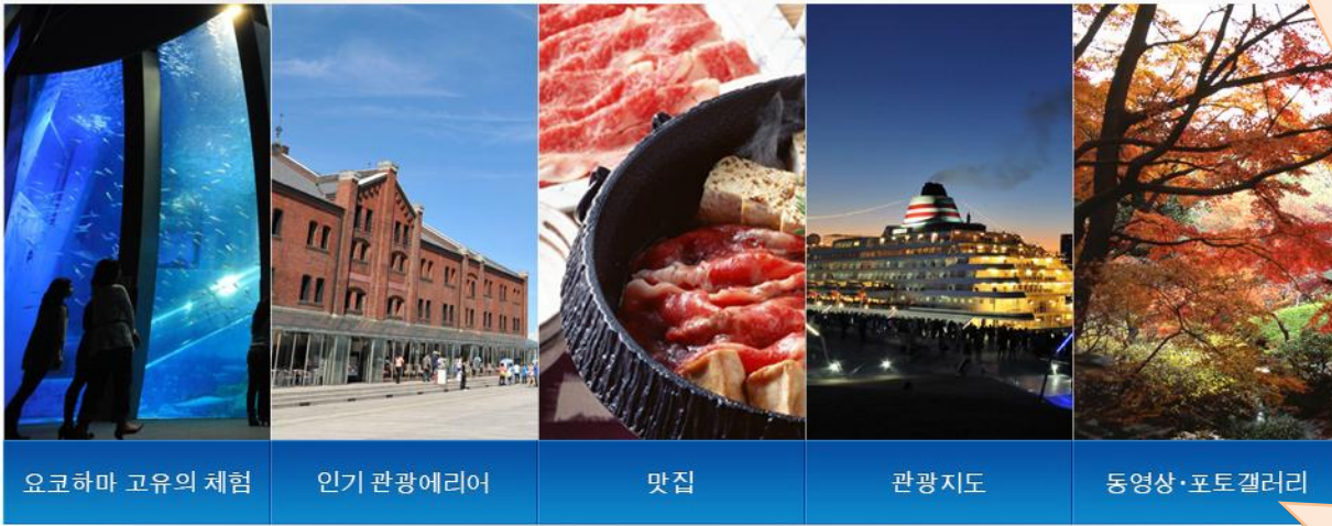
요코하마 고유의 체험

추천 관광루트 | 호텔·여행회사 | 연중 이벤트 | 교통 | 관광안내소 | Travel tips | 관광자료 다운로드