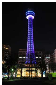
霧笛楼（写真左） スペシャルプランご提供 メニュー例（中央） 横浜マリントワー（右）