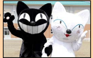
[左:クロネコ、右:シロネコ]

日 時： 7月16日（水）10時10分から11時10分まで （「C I A L桜木町」のオープニングセレモニーは9時40分から10時） 場 所： 横浜市中区桜木町1-1 C I A L桜木町 南改札正面 観光案内所・クロークカウンター 内 容： ヤマト運輸のキャラクターが皆様をお出迎えします。