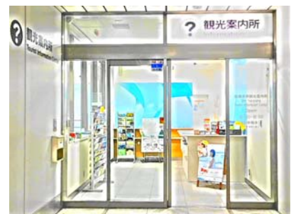
[新横浜駅観光案内所 リニューアルイメージ]