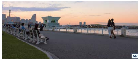
※「横浜ビズターズガイドブック版」から抜粋

AppStore、Google Play にて「COCOAR2」を検索してダウンロードし、アプリから、右の画像を読み込んでみてください。