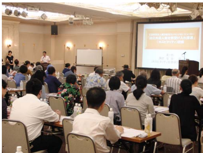
過去のホスピタリティ研修の様子