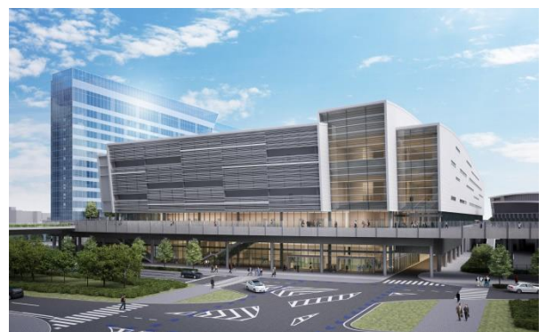
【パシフィコ横浜ノース完成予想図】

※本内容は、独立行政法人日本政府観光局（JNTO）も同日に記者発表を行っています。