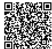
▲特設ページ QR コード